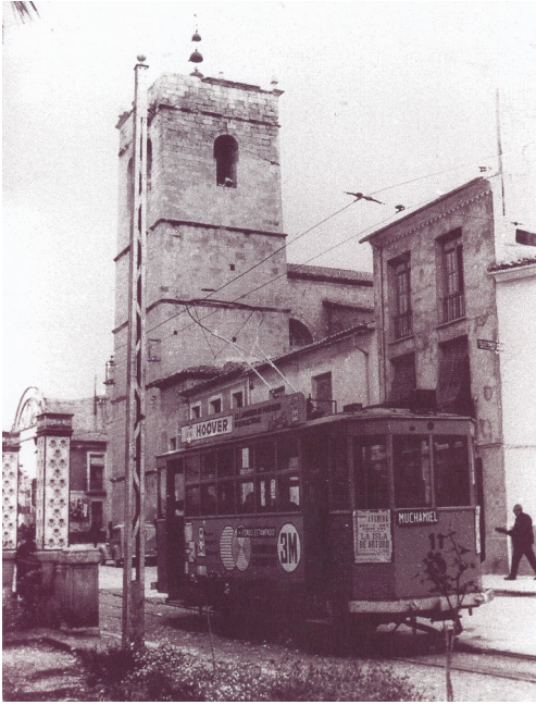
El tramvia a la Plaça Nova