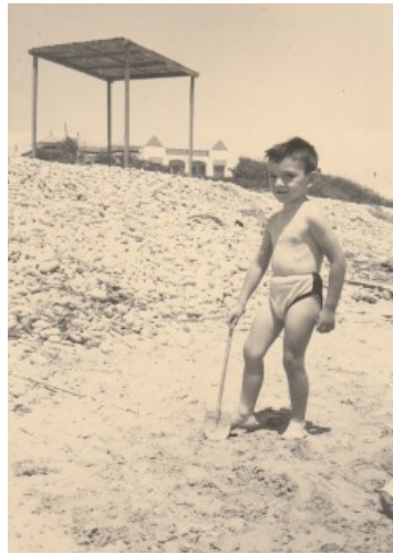
Observeu l'altura de les pedres sobre l'arena