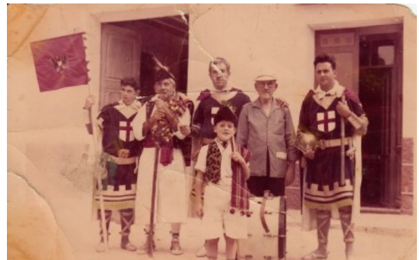
Tres generacions de festers.