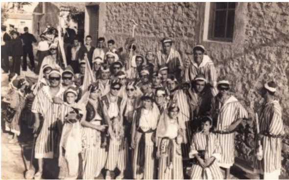
Els Pacos al Ravalet abans de desfilat