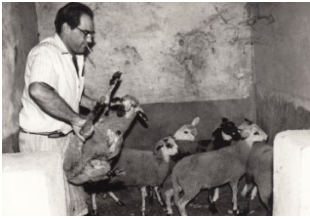
A la faena