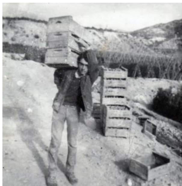
Carregant les caixes de tomates