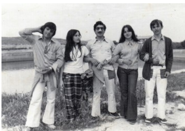
Amics de mona al Pantanet