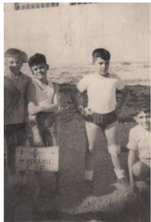
Preparats per jugar al futbol