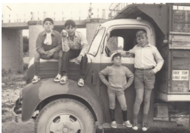
Amics de mona al pont de Busot