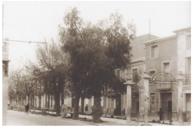
Vista del Passeig