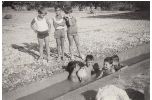
Banyant-se a la séquia