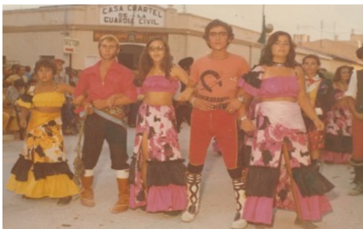
Contrabandistes desfilant a l'altura del quarter