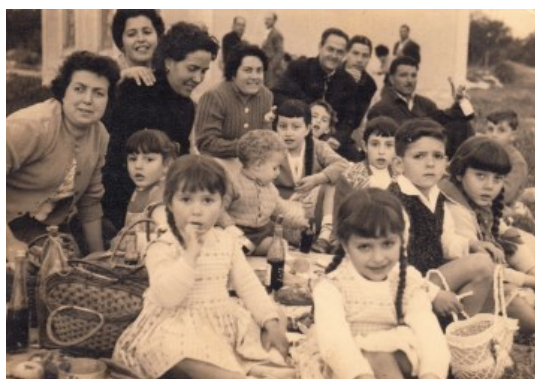
Berenar de mona