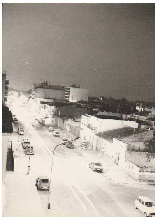
La Rambla de nit, finals dels anys 70