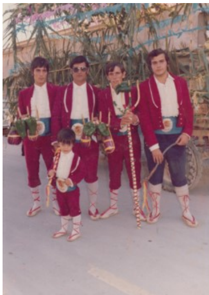
Maseros. Anys 70