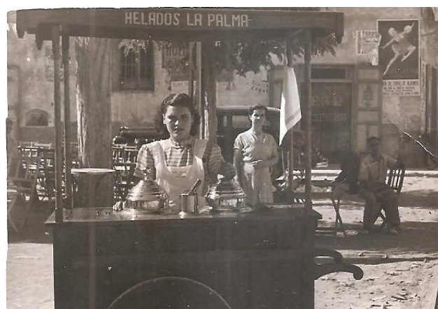
Carret del gelat a la Plaça Nova