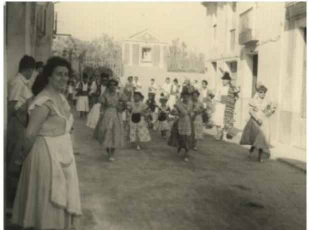
Els Maseros a l'Entrada desfilant pel carrer Sant Vicent