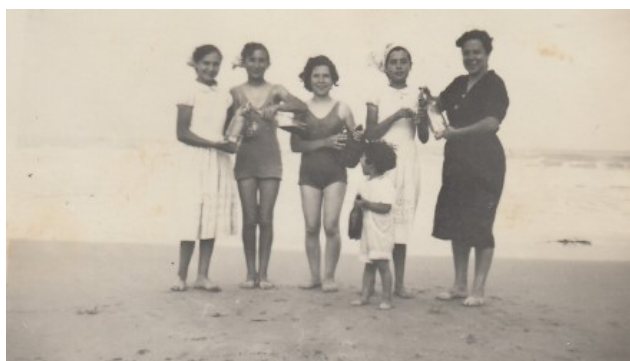
Els banyadors de l'època