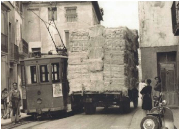
Carrer Cura Fenoll (carretera)