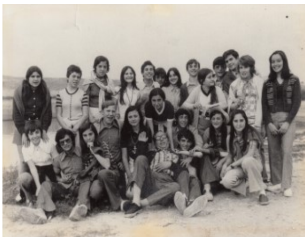
Una "quadrilla" de mona