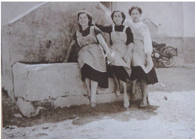
Abeurador situat al carrer de la Mar