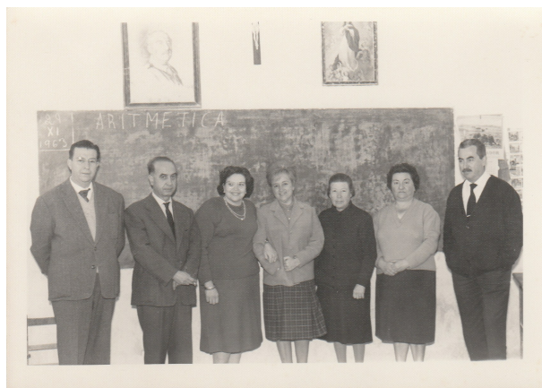
Els mestres del Grup Escolar en una de les classes. Any 1963