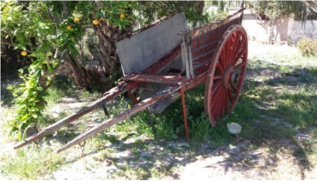
Carro, vestigi d'aquell temps