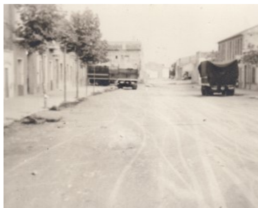
Vista de la Rambla amb els camions de Ripoll