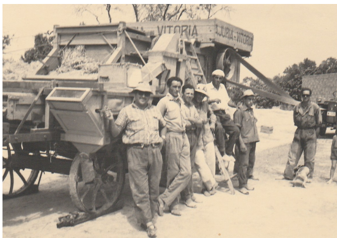
Trilladora de la Cooperativa a l'era. Anys 60