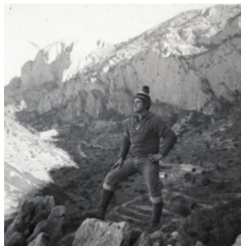
A la muntanya

Per Setmana Santa, el Dijous Sant, com ja hem dit abans, deixava de sentir-se música perquè el Senyor havia mort. A la tele les pel·lícules eren totes relacionades amb la vida de Jesús o de Sants, la música era sacra i a les cases i als bars no es podia posar música. Si cantaves o xiulaves et deien: «Calla que el Senyor està mort!». Als bars, les màquines de discos restaven apagades fins al Dissabte de Glòria i quan es sentien les campanes anunciant la resurrecció del Senyor sempre havia algú que s'encarregava de posar un disc a la màquina. Una manera d'eixir de casa era apuntar-se a l' Adoración Nocturna , d'eixa manera podies quedar-te tota la nit amb els