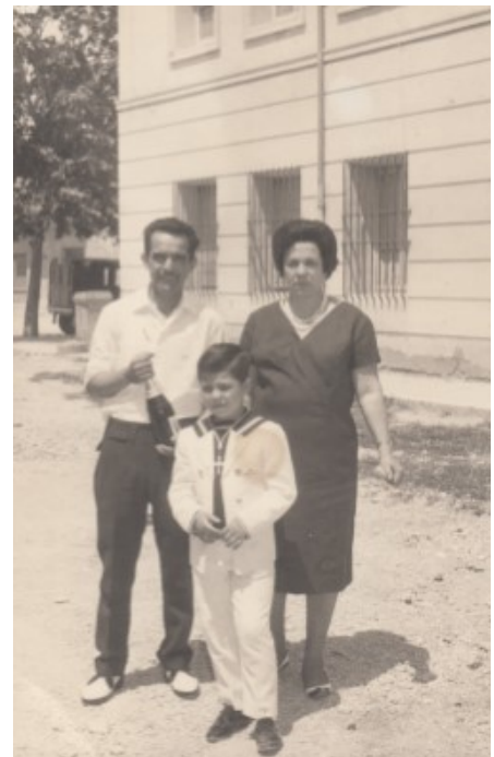
Amb els pares a la celebració