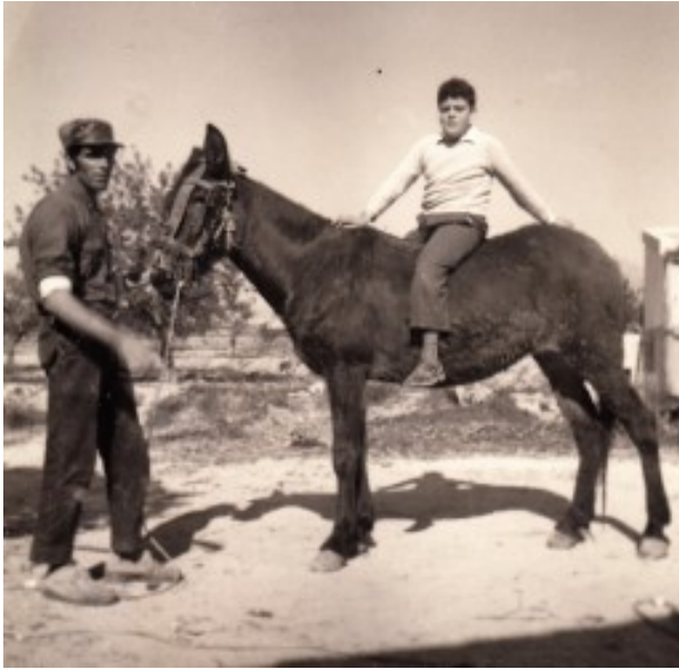
La primera cavalcada