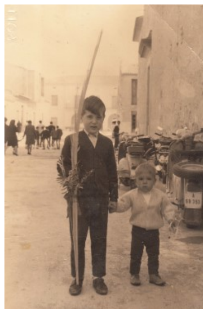
Diumenge de Rams, al Fossar