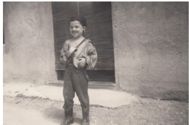
Un Pirata a la porta de sa casa en la Rambla