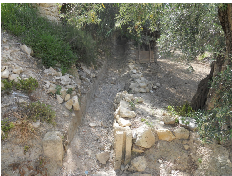
Séquia amb els canets on posar el partidor per regular l'aigua