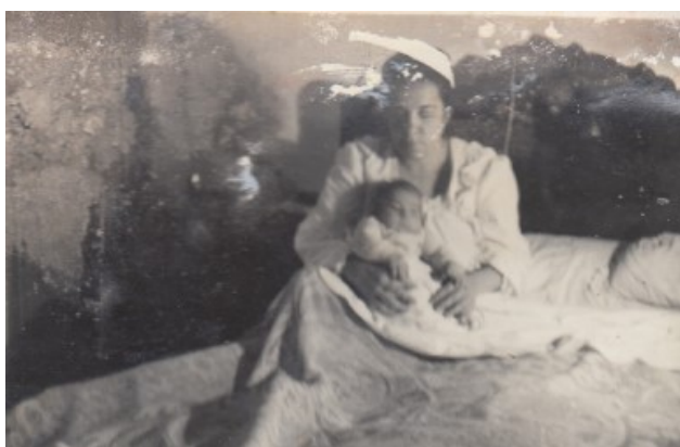
La mare encara al llit amb el seu nadó