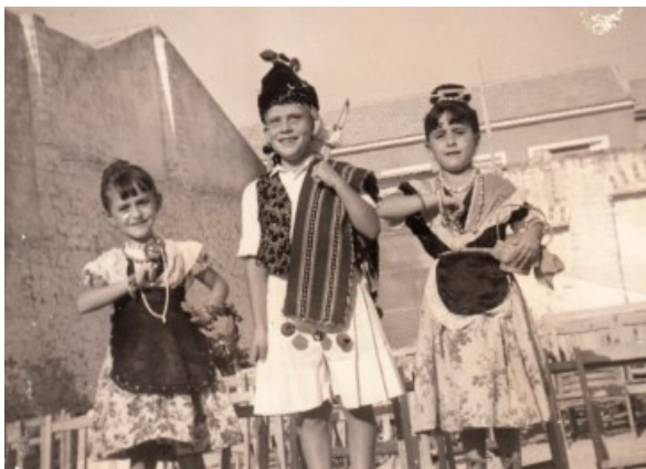
Tres Maseros damunt les cadires del cine d'estiu