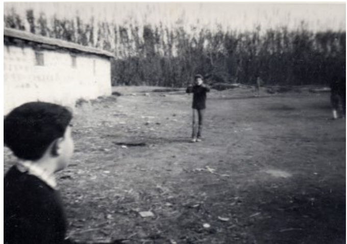
Jugant en el bancal