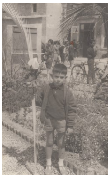
Diumenge de Rams, a la Plaça Nova

El primer de maig era el dia del treballador, molts se n'anaven de paella al camp. Després, a la vesprada, feien la «Demostración Sindical» a la tele, on es mostraven les habilitats gimnàstiques i de coordinació dels treballadors.