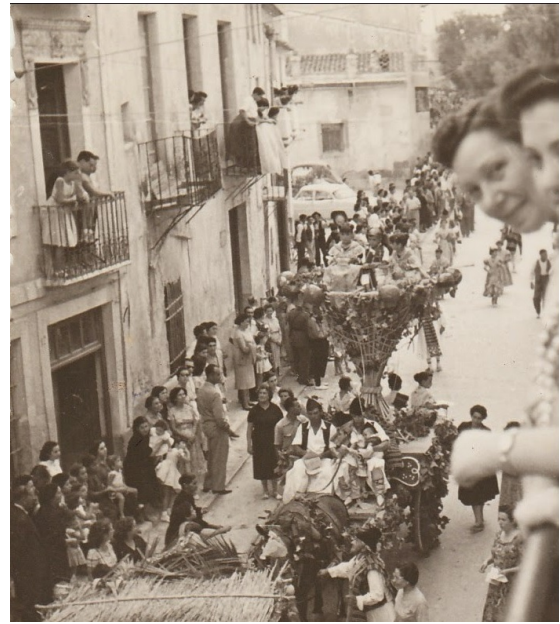
Carrossa dels Maseros desfilant per la carretera