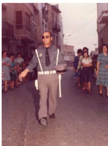
"Juanito el Municipal" en una processó

"Eraso o m." (cerámica sobre gres, a tres colores).