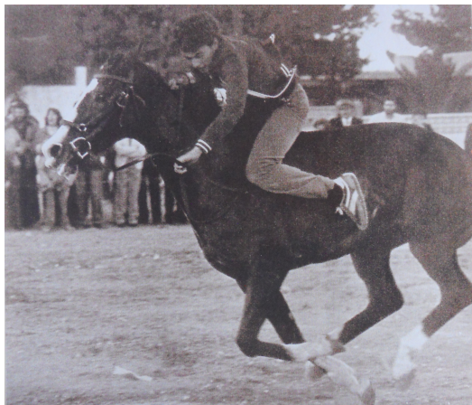
Carreres de cavalls al Calvari