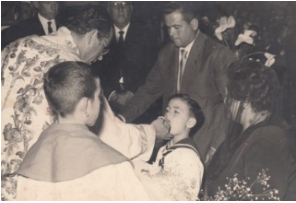
D. Juan donant la comunió