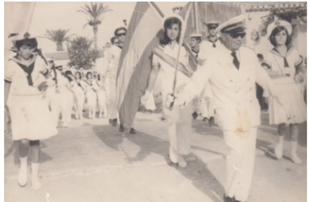
El "Dàtil" al front de la comparsa "Marinos"