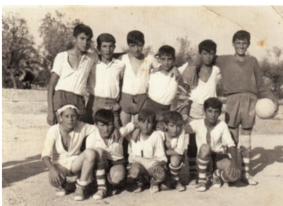
Equip de futbol

Als 16 anys els més valents es compraven o es feien regalar una motocicleta per poder viatjar més lliurement. Més endavant, quan complien els 18 anys tots desitjaven tindre un cotxe o una moto. Per això, havien de traure's el carnet de conduir, que no era fàcil. Ja que, a més dels diners que costava, havien d'anar a Sant Joan o a Alacant, que és on estaven les autoescoles. Per a pagar les despeses del carnet de conduir, més d'un va haver de traure's un jornal com va poder.