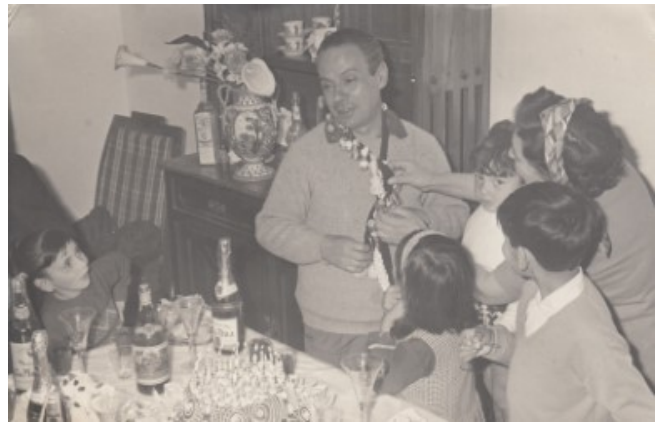
Celebració d'un aniversari

El dos de febrer, des de l'escola, els mestres duïen els xiquets a la missa de «La Candelera» on els donaven un ciri prim de color, que s'encenia en casa els dies de tempesta per salvar-los dels llamps . El mateix passava el «Dimecres de Cendra», en què el cura els feia una creu de cendra al front, que procuraven que no se'ls esborrara fins a arribar a casa.