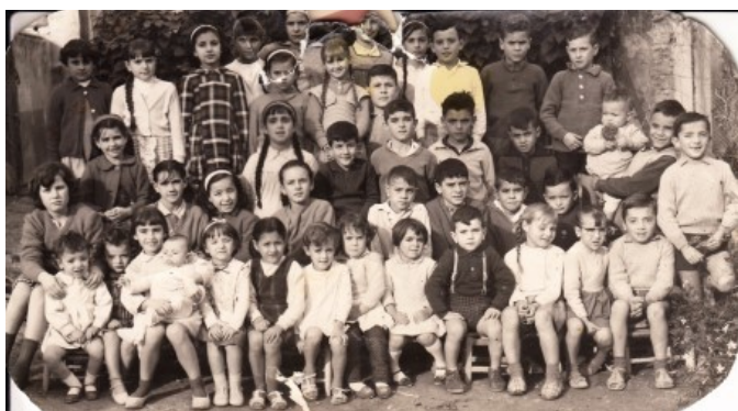
Escola del Ravalet. Curs 62-63

Per altra banda, a la «cancela» de l'entrada de l'església, es penjaven les «amonestacions» unes setmanes abans de les bodes perquè es sabera qui anava a casar-se. També es penjaven les valoracions morals de les pel·lícules que anaven a projectar-se als cines, des de les «Tolerada para menores» fins a les «Mayores con reparos».