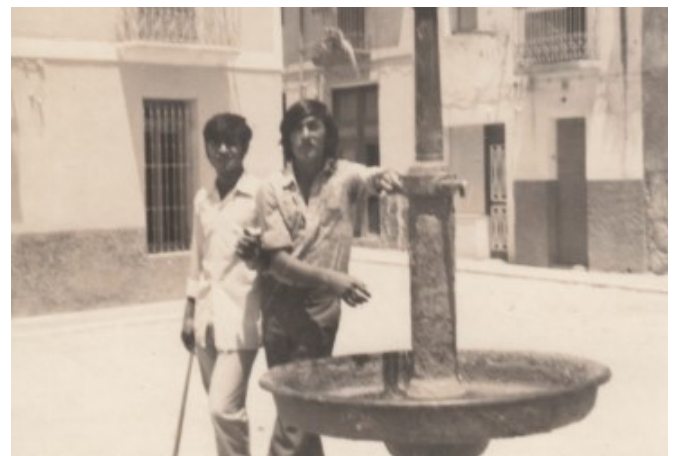
Font de ferro al Ravalet