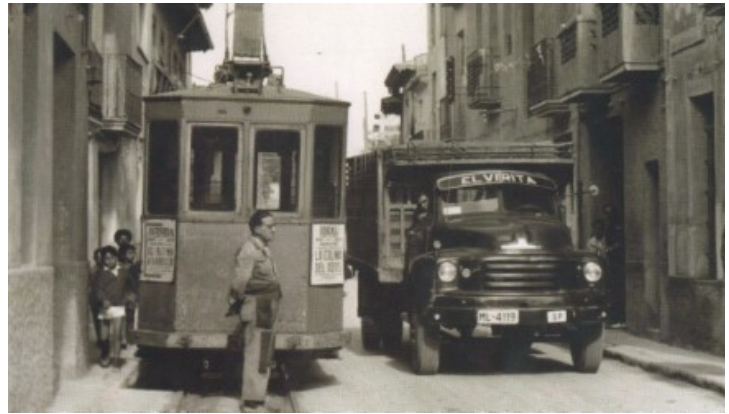
Carrer Manuel Anton (carretera)