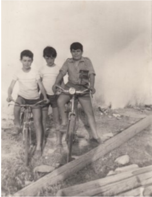
Amics en bicicleta

pròrroga fins acabar els estudis. D'altra banda, la majoria d'edat i, per tant, el dret a votar no es tenien fins a complir els 21 anys, que venia a ser poc més o menys quan acabaves la mili. Per poc, però, van arribar a poder votar la Constitució de 1978.