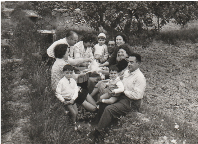
Pelant el pollastre per a la paella