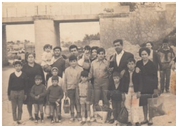
De mona al pont de Busot