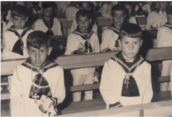
A la cerimònia