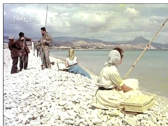
La platja de Mutxavista vista pel NODO