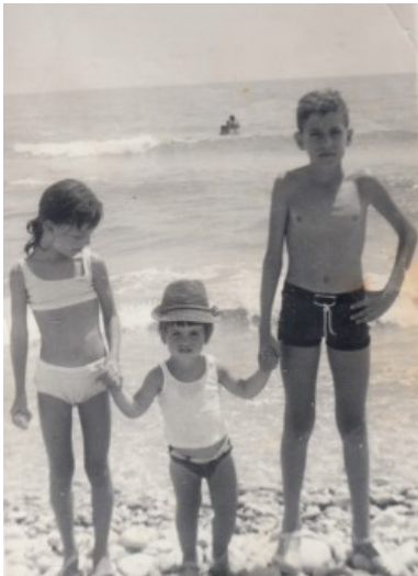
Els xiquets a la platja