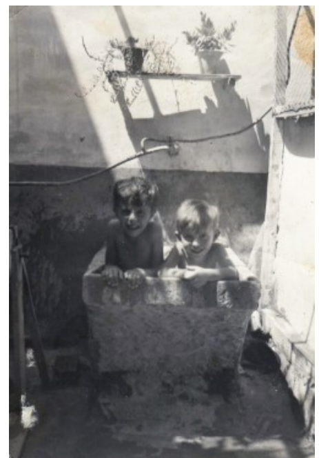
El bany a la pica