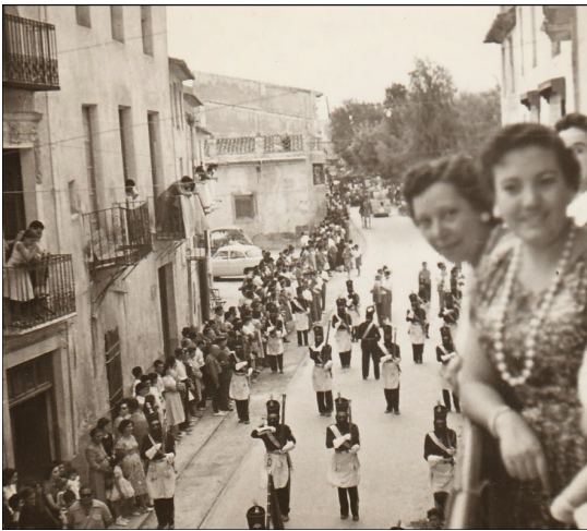
Els Gastadors obrint la desfilada de l'Entrada

tard, els festers de totes les comparses i els músics es reunien per fer una paella, als anys 70 es reunien a les finques de l'Eucalipto o dels Picolons.