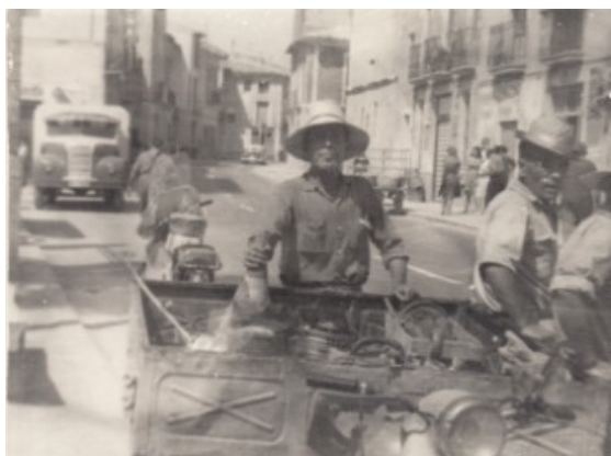
Arreglant la carretera, anys 60

Any darrere any, els canvis socials i estructurals van afectar les seues vides. Uns de ells començaven a treballar, uns altres estudiaven a Alacant, a l'Institut o al col·legi Juan XXIII majoritàriament, que tenien els autobusos per a traslladar els estudiants des del poble al centres respectius i que feien «piques» entre els estudiants dels dos centres.