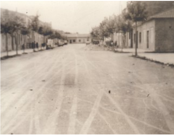
Vista de la Rambla des de l'ajuntament cap al nord