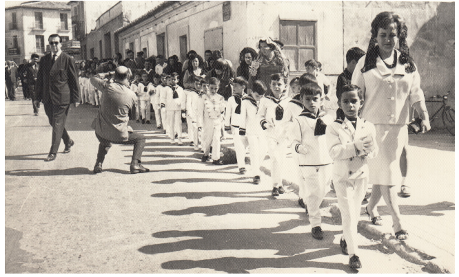
Anant a combregar acompanyats dels mestres i pares