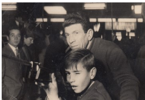
En la caseta de tir al blanc

El 12 d'octubre es celebrava la Mare de Déu del Pilar, un altre dia senyalat per a felicitar les Pilars i, per ser la Patrona de la Guàrdia Civil, els guàrdies es posaven els seus uniformes de gala per assistir a missa.