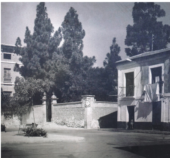
Al Poble Nou. La roba estesa al balcó