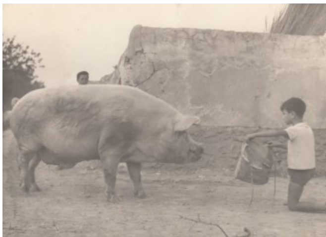
Jugant a torero