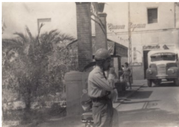
La Plaça Nova, al fons es veu el cine España