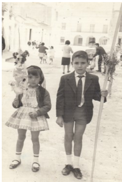
Diumenge de Rams, al Fossar