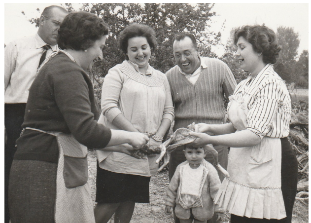
Preparant el conill per a la paella

La Vera Creu, el 3 de maig, era una festa per als xiquets perquè es reunien per anar per les cases demanant: «Una llimosneta per a la Vera Creu», al que els responien «La Vera Creu no menja» i ells contestaven: «Però mosatros sí». Amb el que arplegaven de menjar per les cases berenaven al voltant d'una creu de flors que cada carrer feia.