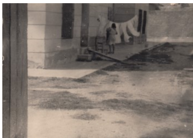
L'Ajuntament, on vivia "Juanito el Municipal"