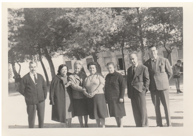
Mestres al pati del Grup Escolar. Any 1963