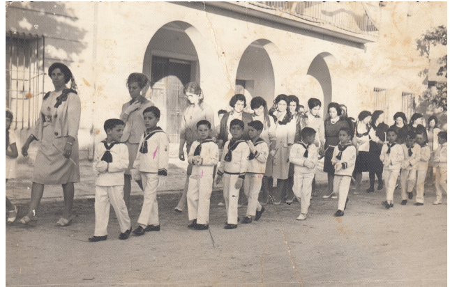
A l'eixida de la comunió cap el Grup Escolar