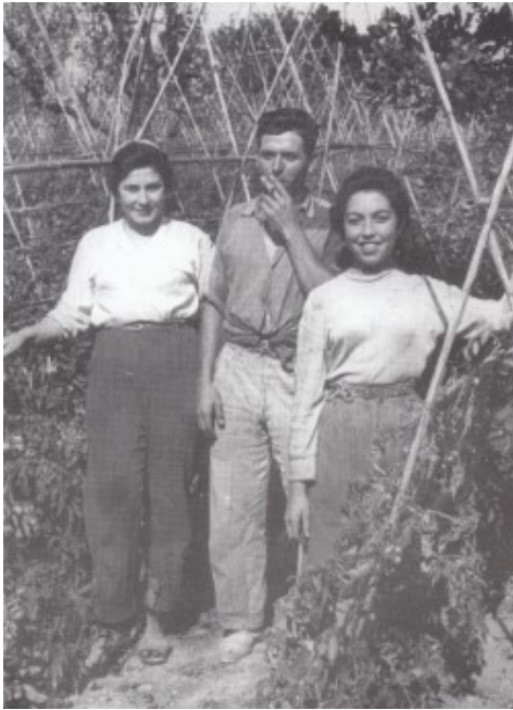
Entre les tomateres