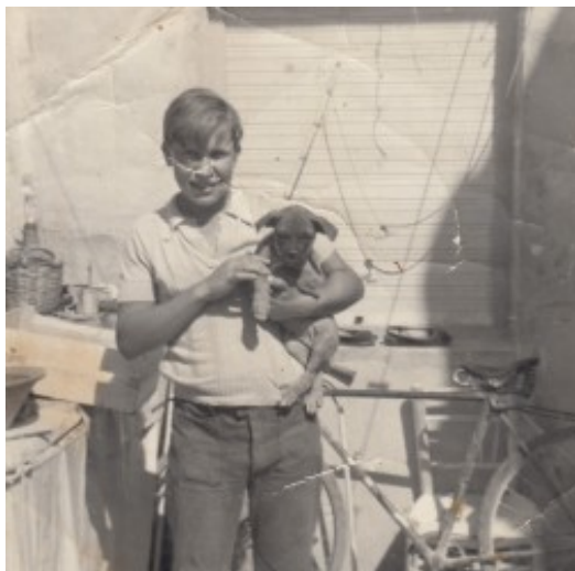
Amb el gos i la bicicleta al darrere