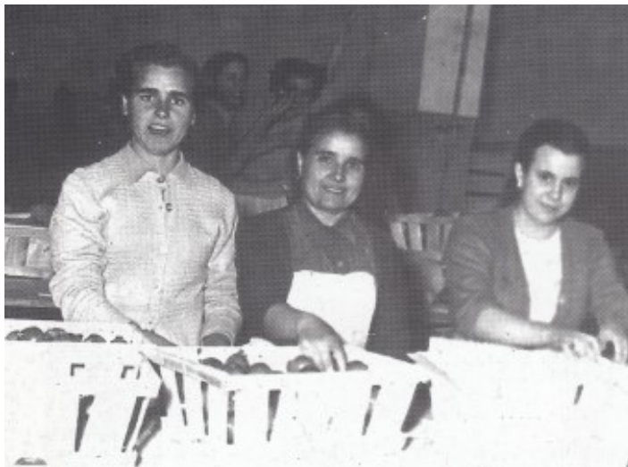
Al magatzem de tomates