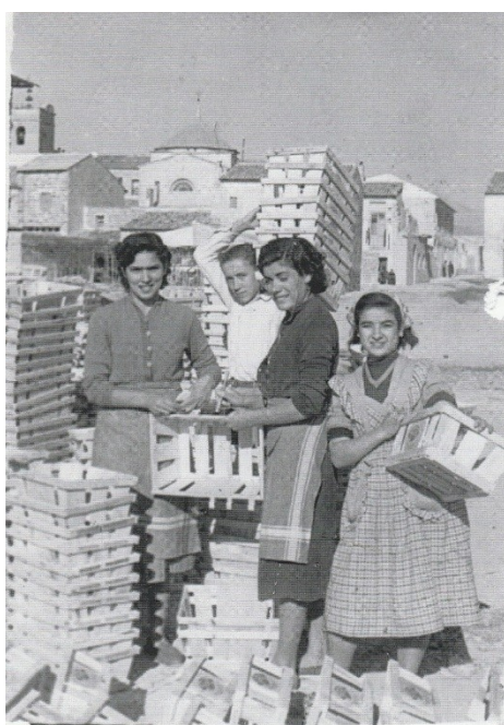
Preparant el ceretos per envasar les tomates