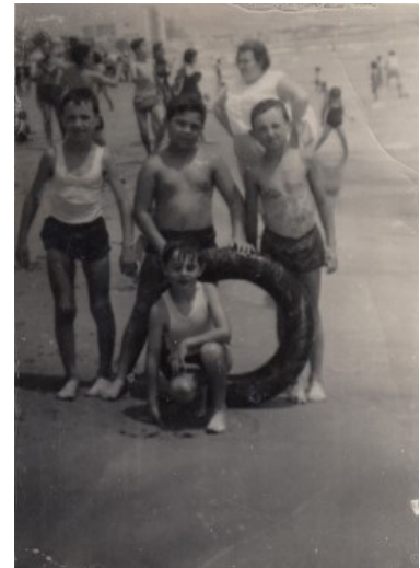
Els xiquets amb la roda

L'estiu, el passaven molts d'ells assajant per a les festes de setembre. Els que anaven a desfilars en esquadra es reunien una o dues vegades a la setmana per assajar el pas per fer una bona impressió al desfilars de «l'entrà». D'eixa manera també es cohesionava el grup de festers. Per combatre la calor, era normal que els sopars es feren a la porta de les cases i que els veïns s'ajuntaren a l'hora de sopar mentres feien la xerrada a la fresca.