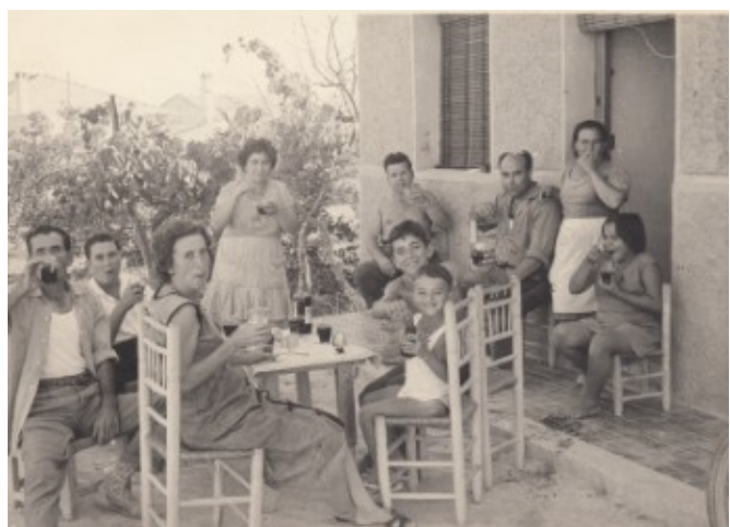
Refrescant a la porta de casa