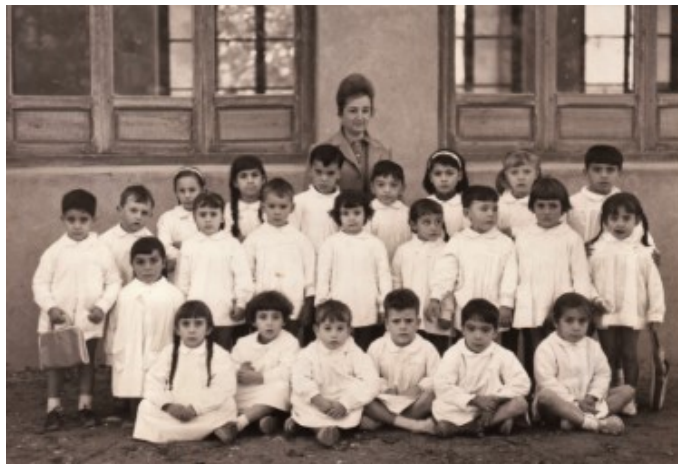
Classe de pàrvuls 1962