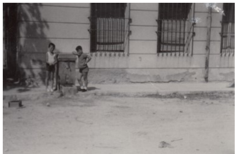
Font al costat de l'Ajuntament