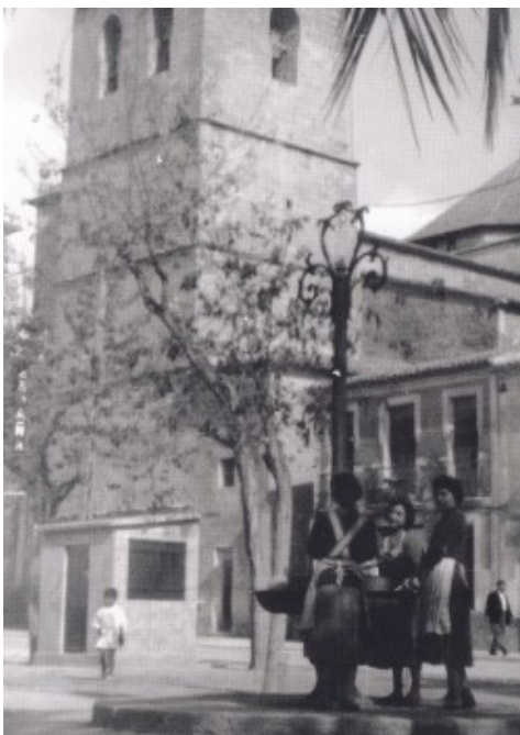
Font de ferro a la Plaça Nova