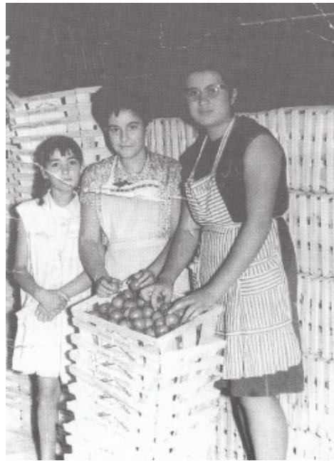
Al magatzem entre els ceretos