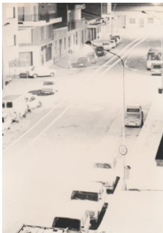
La Rambla de nit, finals dels anys 70