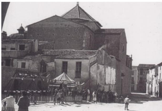
Les barquetes a les festes