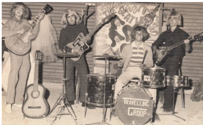
Emulant als Beatles

Una manera de fer colla era la mona, els xics buscaven les xiques perquè els posaren el berenar mentre ells eren els que s'encarregaven de comprar la beguda. Els llocs on anaven tradicionalment de mona eren les Fontetes, el pont de Busot i el Calvari. Posteriorment, aquests llocs els van canviar i anaven a la caseta d'algu de la quadrilla o bé, buscaven lloc en altres colles d'altres pobles de la comarca o a Alacant, segons el cas.