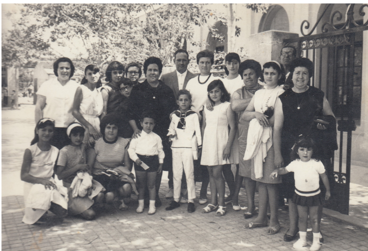
Amb la família a la porta del Grup Escolar