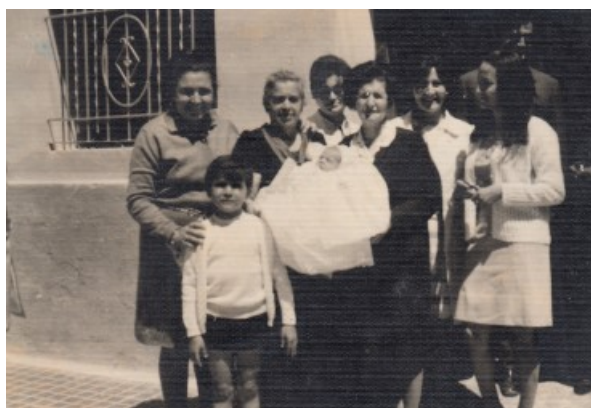
El nadó en bolquers per al bateig