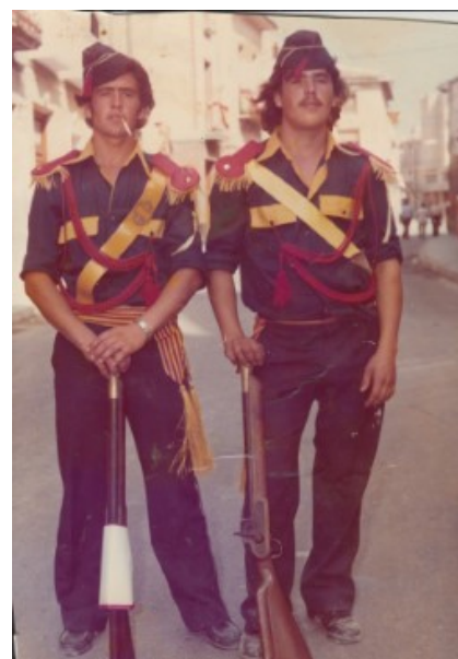
Gastadors. Anys 70