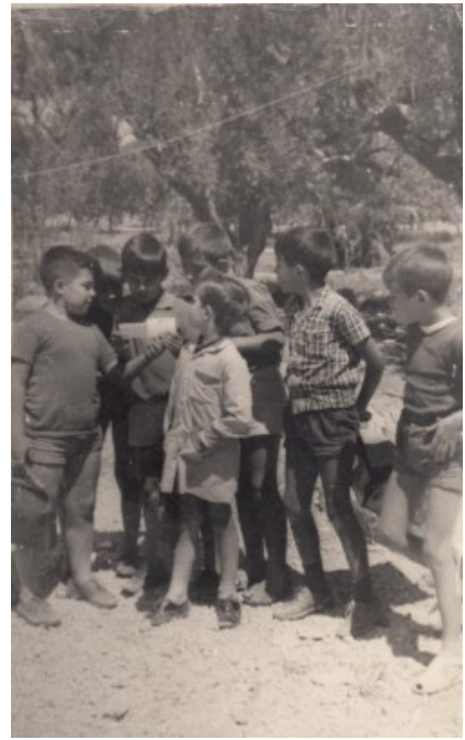
Jugant en el bancal