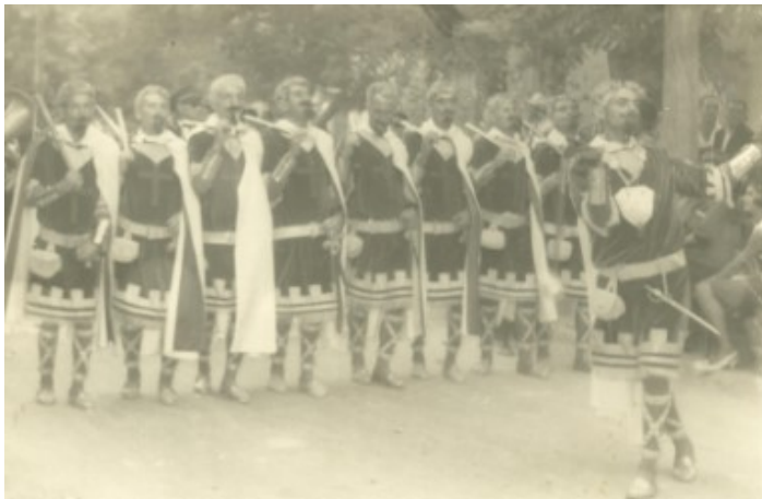
Tonet al front dels Templaris

«Ocho», a qui et podies trobar al bar i desfilant amb «Els Pacos». Sembla ser que el seu malnom prové del fet que ell deia: «Ocho a ocho barrageiton». De vegades, mentres amb les mans feia com que disparava, deia: «Im-be-si-li-di-to. Pom, pom, pom».