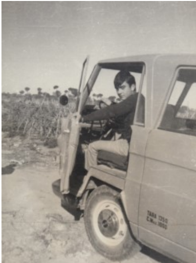
En furgoneta per a treballar