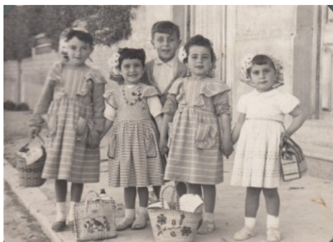
Amb els cabassets de mona