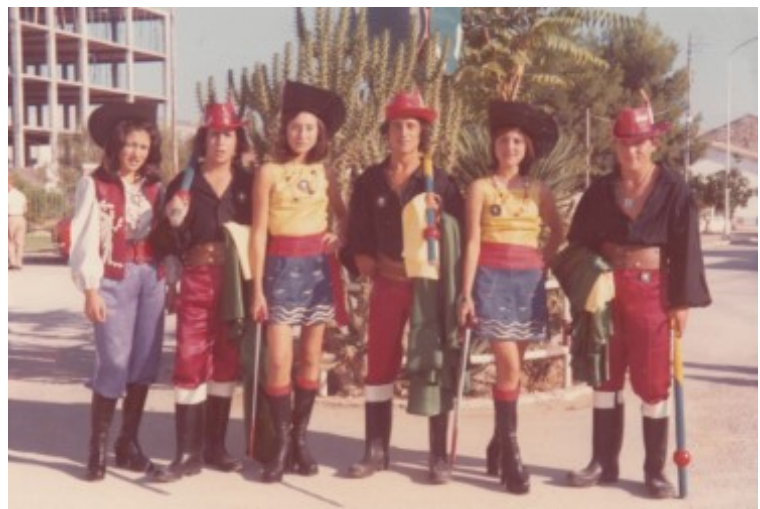
Pirates, a la rotonda de la Rambla. Anys 70