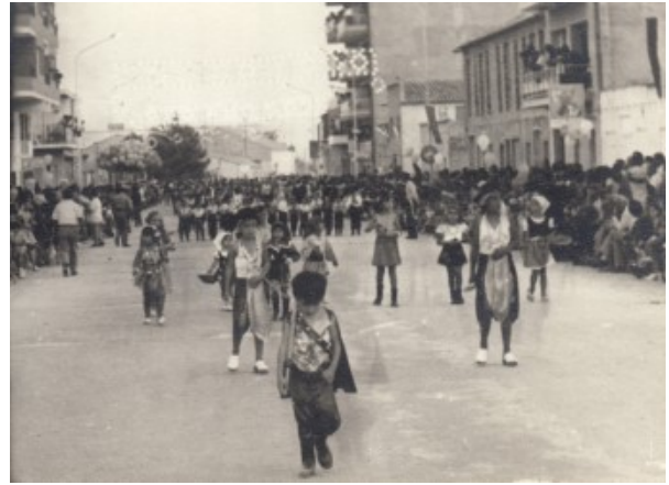
Desfilant per la Rambla. Anys 70