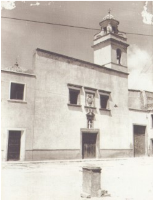
Font a la placeta del Convent