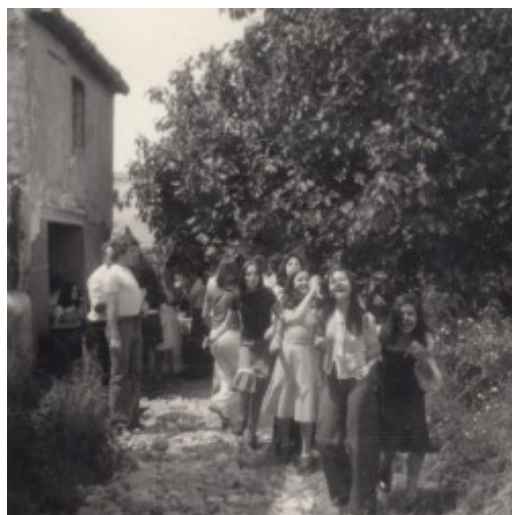
De mona en una casa de camp