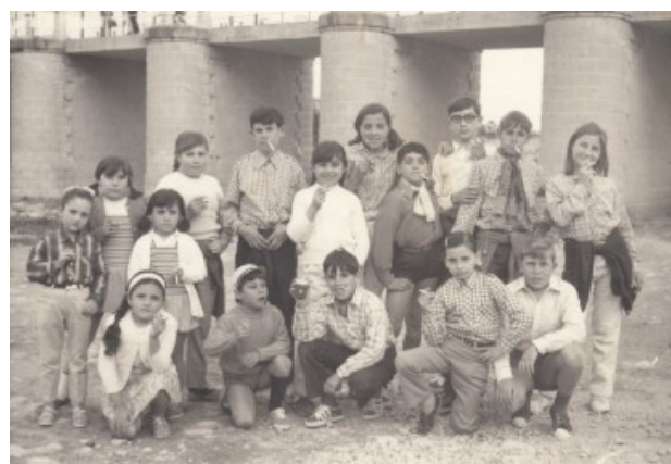
Colla per a la mona al pont de Busot