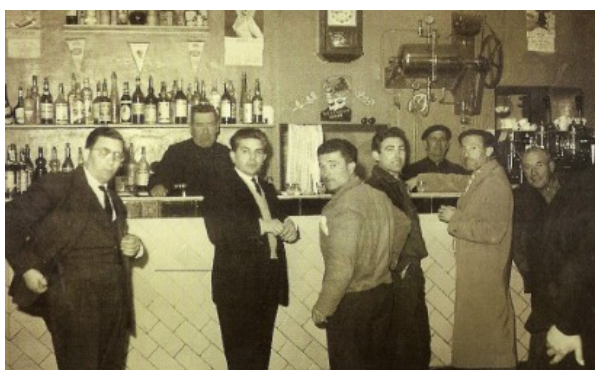
A l'interior del bar Chimenera