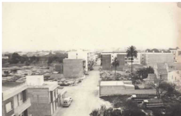
Carrer Mare de Déu del Pilar. Al voltant de 1970