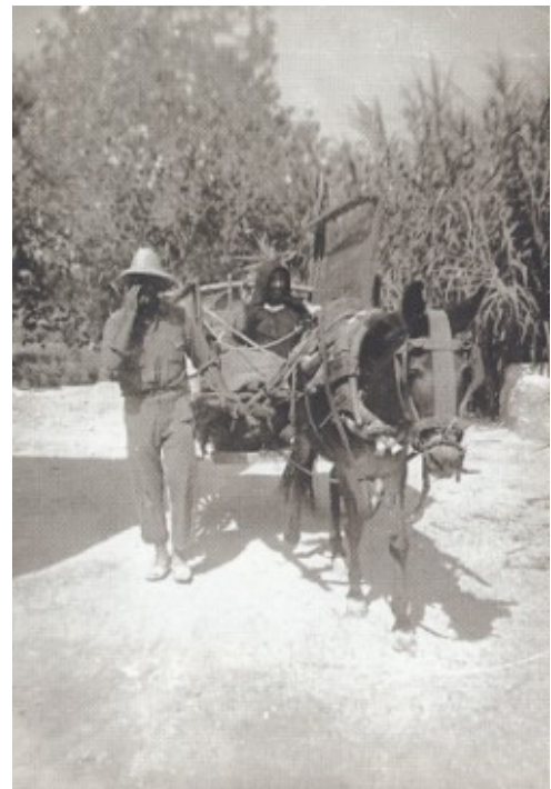
Carro al bancal