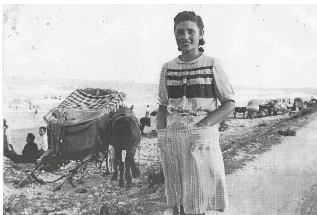
A la platja, es veuen els carros i els animals

A l'estiu hi havia unes quantes festes, com era el 18 de juliol, aquest dia, el més normal, era anar a la platja i passar el dia allí, deixant el meló d'aigua enterrat a la vora de la mar perquè estiguera fresc. El mateix es feia els dies de Sant Jaume i de l'Assumpció, ja que eren els dies típics d'estiu on tot el que podia anava a pegar-se un bany. A la platja de Mutxavista, on estaven les pedres, era on anaven la majoria dels mutxamelers. Allà, anaven en els carros i aprofitaven per banyar els matxos i mules a la mar, ja que estaven bruts després d'haver estat fent les faenes de batre al camp els dies anteriors. L'agost començava amb la festa del Salvador, coneguda també com el «dia del Senyal», ja que a la processó eixien les banderes de les comparses acompanyant al Capitans i Abanderats en la seua primera presentació al poble.