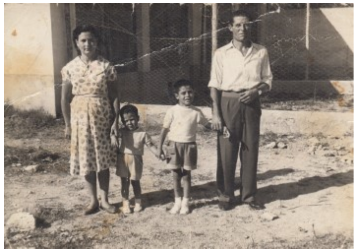
Al pati de la casa, el galliner al fons