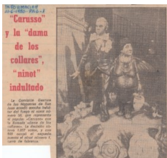
"Carmen la Manaeleta" com a ninot indultat