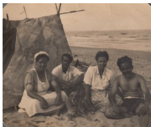
Un dia de platja