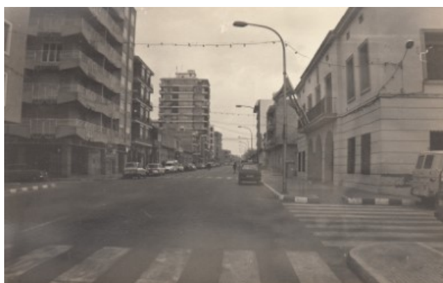
La Rambla anys 70