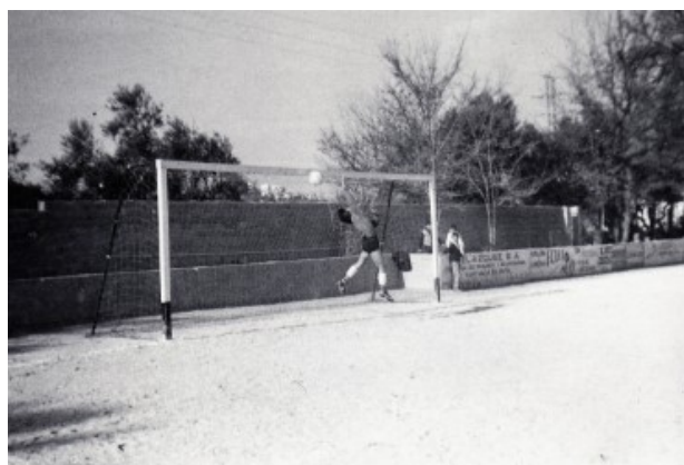
Al camp de futbol Els Oms